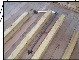
Détails du raccordement entre la bonde du bain et votre vidange